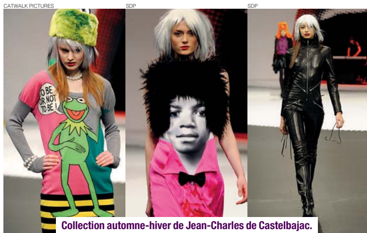
Collection automne-hiver de Jean-Charles de Castelbajac.